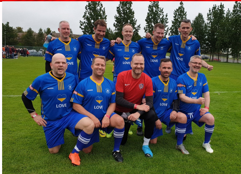
Úkraína var búningahönnuðum Ungmennafélagsins Ópökka ofarlega í huga á Pollamótinu 2022.

Alls skráðu 67 lið sig til leiks á mótinu, sem er metþátttaka, en að okkar bestu vitund höfðu þátttökulið orðið flest 62 áður, árin 2015 og 2021. Fjöldi karlaliða var svipaður og undanfarin ár, en það voru konurnar sem áttu heiðurinn að þessari fjölgun. Þar höfðu liðin