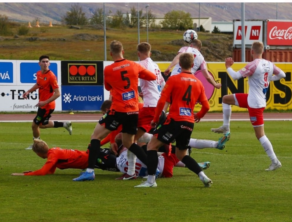
Úr leik Þórs og Fylkis í Lengjudeildinni 2022.

Í fjárhagsáætlun Akureyrarbæjar fyrir næstu ár er gert ráð fyrir fjárveitingum vegna Þórs-svæðisins árin 2024 og 2025, 180 og 185 milljónum króna. Reikna má með að þessar fjárveitingar fari í að byggja upp gervigrasvöll á Þórssvæðinu. Þessar tölur eru óháðar því hvort og hvenær gervigras í Boganum verður endurnýjað enda er Boginn ekki hluti af Þórssvæðinu á sama hátt og æfingasvæðin og keppnisvöllurinn úti þó svo Boginn hafi verið byggður á Þórssvæðinu. Eins og flestum ætti að vera kunnugt er tímum í Boganum úthlutað til